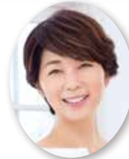
© 小池哲夫 総司会 中井 美穂 アナウンサー