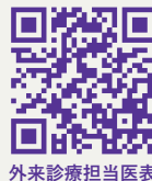
外来診療担当医表