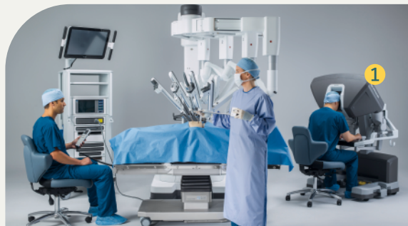
▼ダビンチによる手術のイメージ