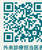
外来診療担当医表

[面会時間] 14:00～17:00 (1日1回30分まで) [人数] 2名様まで ※1階受付の入院患者さんへの荷物のお預かりは、終了しました。面会時間内に直接患者さんにお渡しください。 ・初診で紹介状をお持ちでない方は、選定療養費として別途7,700円(税込)をいただきます。 ・再診予約時間の変更は、平日の14時～16時にお電話ください。(お電話口で診療科をお伝えください) ・正面玄関は8時から開錠します。 ・外来診療担当医表はHPに掲載しています。右のQRコードからご覧ください。