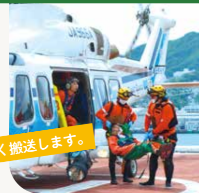
▲2024年6月に行われた、海上保安庁ヘリ離着陸訓練の様子

当院の屋上には、ドクターヘリ等が発着できるヘリポートが設置されています。搬送専用のエレベーターがあり、受け入れ患者さんを速やかに救命救急センター(1階)へ搬送することができます。