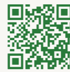
外来診療担当医表