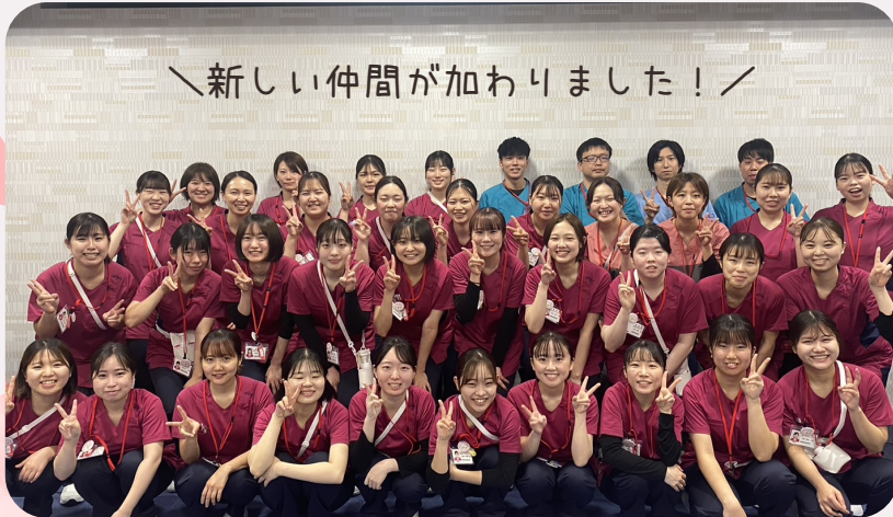
＼新しい仲間が加わりました！／

今年度も『ひよこだより』を通して、新人研修の様子や新人さんの成長をお伝えしていきますので、お楽しみに♪