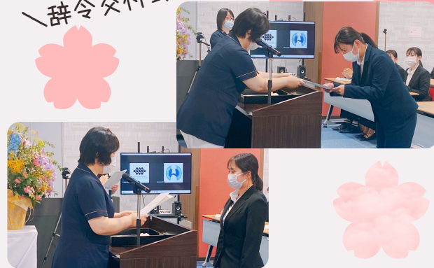
部署の師長さん ＼先輩との交流会／