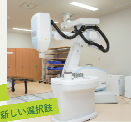
▲サイバーナイフ (Cyber Knife®)

がんが骨に転移すると「痛み」や「麻痺」といった症状が現れ、日常生活に大きな支障をきたすことがあります。当院ではこれらの症状を和らげるために、サイバーナイフによる定位放射線治療を行っています。この治療法は、高い放射線量を腫瘍に集中してあてることができるため、一般的な放射線治療よりも効果が高く、治療期間も短くなります。また、治療の効果が早く現れるため、患者さんの生活の質を早く改善することが期待できます。