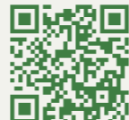
外来診療担当医表